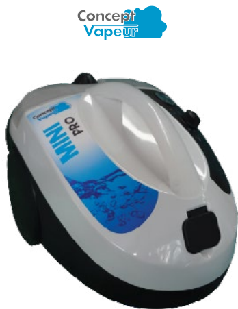
1 CV MINI PRO 169410

est une méthode efficace, innovante et écologique. Cette méthode diminue les risques allergiques et les risques de développement des résistances bactériennes. De plus, elle permet de réduire l'impact environnemental de 80% par rapport à l'utilisation d'un détergent désinfectant chimique.