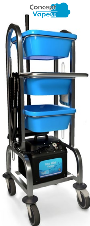
2 BOX MINI CHARIOT 161366

Nettoyeur vapeur semi professionnel à remplissage en continu pour des usages pouvant aller jusqu'à 1h30 par jour.