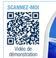
3 CV ONE 156710

Générateur vapeur assurant le bionettoyage des surfaces au quotidien. Conception ergonomique, intégrant le chariot de bionettoyage. Conçu pour une utilisation jusqu'à 8h par jour.